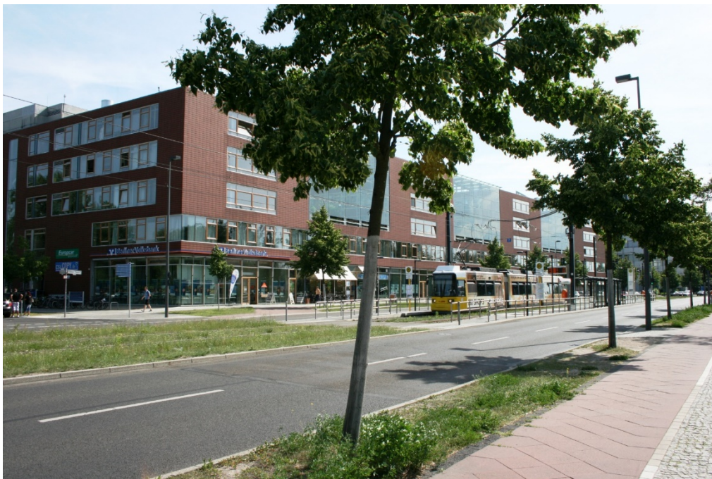
Institut für Mathematik, Johann von Neumann-Haus

Auf den folgenden Seiten finden Sie wichtige Informationen, die Ihnen den Einstieg an der Universität erleichtern sollen.