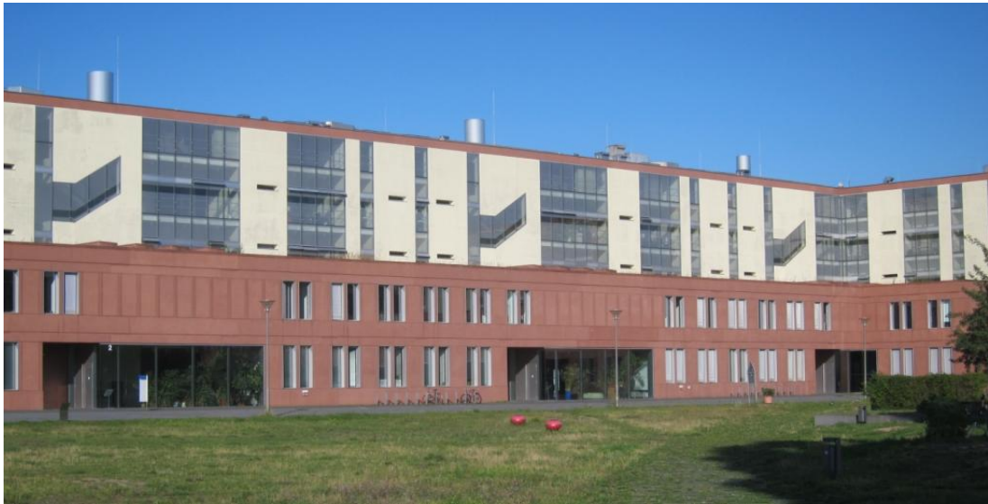
Institut für Chemie, Emil Fischer-Haus

Auf den folgenden Seiten finden Sie wichtige Informationen, die Ihnen den Einstieg an der Universität erleichtern sollen.