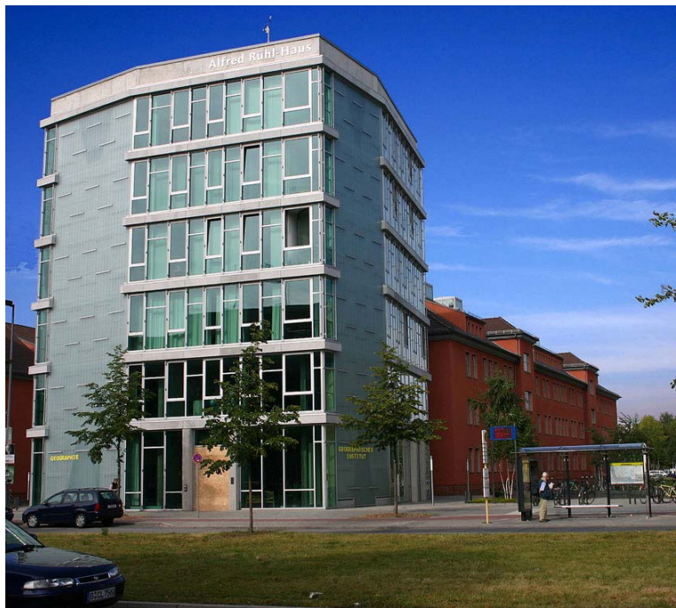
Geographisches Institut, Alfred-Rühl-Haus

Auf der nächsten Seite finden Sie wichtige Informationen, die Ihnen den Einstieg an der Universität erleichtern sollen.