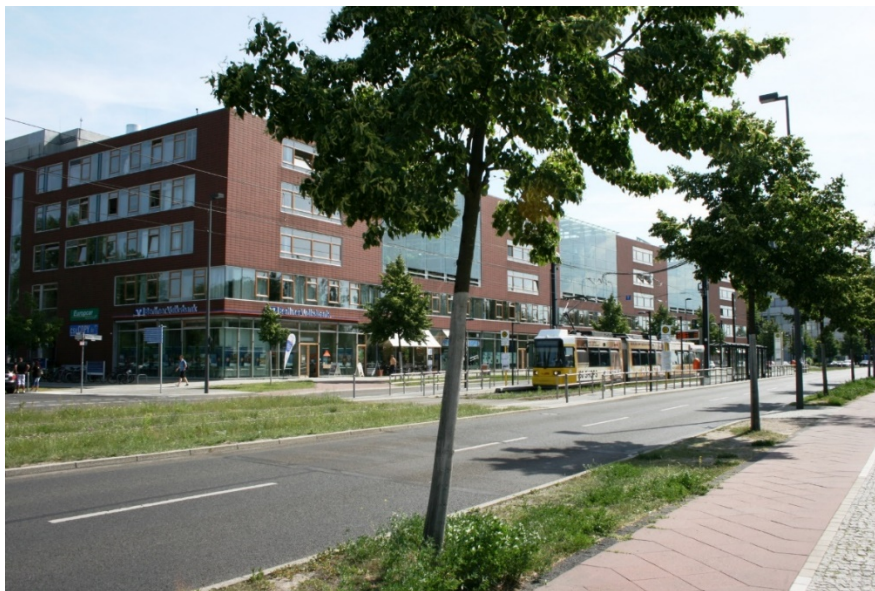
Institut für Informatik, Johann von Neumann-Haus